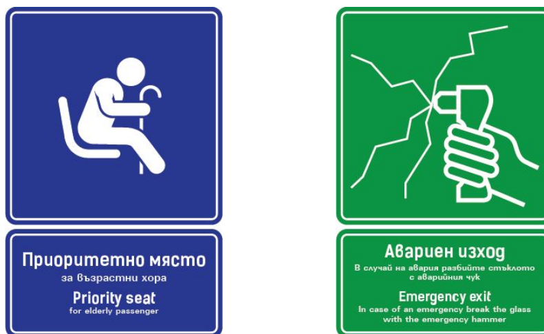
Пример за дизайн на стикерите

Дизайнът, който фондация Спаси България ще разработи има за цел да отрази спецификите на Софийския градски транспорт и неговите потребители: да въведе нужни международни символи в употреба, както и да уеднакви символите, използвани в различните превозни средства. Целта е както визуално (еднакво поднасяне на информацията), така и функционално (еднакво разположение на стикерите в различните превозни средства) унифициране.