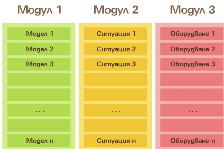
Пример за организацията на модулната архитектура на стандарта

Всеки модул е разработен самостоятелно, но в рамките на единна концепция за дизайна на целия градски транспорт в София. В процеса на експлоатация може да се установи нуждата от допълването на обхвата на Стандарта. Такава архитектура позволява допълването, промяната или отмяната на отделни компоненти да става евтино, лесно и бързо.